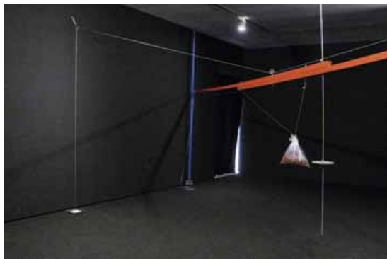
Instabile2008 2008 Instalação [Installation] Dimensões variáveis [Variable dimensions]

He was distinguished with the order of Cultural Merit of Brazil, at the rank of Commander, by the Ministry of Culture and the Mário Pedrosa Prize by the Brazilian Association of Art Critics as a creator of contemporary art.