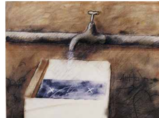
Três da Tarde 1981 Técnica mista sobre papel [Mixed technique on paper] 50 x 65 cm